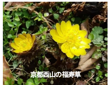
京都西山の福寿草

今年は数年ぶりの寒波に見舞われたこともあり、やや春の訪れが遅いように感じますが、確実に季節は流れており、周辺の山々では春を告げる“福寿草”が見頃を迎えています。この花は名前の通り、日本では古くから福を招く植物として知られており、「幸せを招く」「永久の幸福」という花言葉を持っています。江戸時代には、春を一番に伝える花ということで、「福告ぐ草(フクツグソウ)」という名前と呼ばれていました。特に新年には、南天と一緒に寄せ植えにした正月飾りがよく飾られますが、これは、南天の音が「難を転ずる」ということを表しており、福寿草と合わさって「難を転じて福となす」という意味になるからだそうです。京都の西山周辺では3月の福寿草だけでなく、4月にはカタクリの花が咲くことで知られています。いずれの花も今では人の保護を必要とするほど希少なものとなってきています。せっかくこの乙訓の地で生活しているのですから、春を感じに少し足を伸ばして散策をしてみてください。